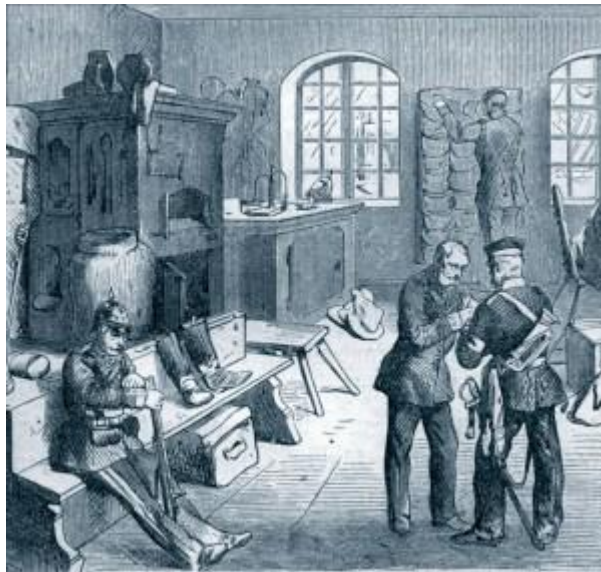
Prusové obsadili budovu v Dubenci