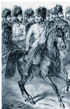
rakouský generální štáb

A tak krátce před půlnocí ožila pole okolo Dubence, Lanžova a Hříbojed desetitisíce probuzených spáčů. Vše velice tiše, bez signálů trubek a víření bubnů. Úmorná pěšácká dřina minulých dnů se stala ještě únavnější. Vojáci byli nedospalí, pít nebylo co, studny v okolních obcích byly vyčerpány. Proviantní kolony se nacházely kdesi daleko, aby nepřekážely přesunu. Na začátku pochodu v Dubenci na sebe narazily pochodové proudy VI. a X. sboru, které vycházely ze svých